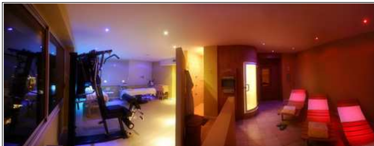
L'Oasi del benessere al piano attico dell'hotel

I prenotati ai trattamenti di massaggio potranno accedere gratuitamente alla zona bagno turco-sauna-doccia scozzese e verranno forniti di accappatoio e ciabattine. Utilizzate la scheda di partecipazione alla Convention anche per prenotare questi trattamenti: solo i prenotati potranno accedervi. Vi verrà comunicato l'orario del vostro turno.