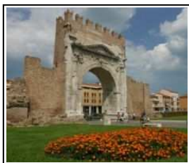
Arco di Augusto

OGGI: non solo spiagge e percorsi d'arte visitati ogni anno da un milione e mezzo di turisti. Rimini è sede di una fortissima industria congressuale e fieristica, grazie anche alle 80.000 camere d'albergo del territorio. Il tecnologico e nuovo Palacongressi è il più grande d'Italia (9300 posti a sedere). Il nuovo quartiere fieristico, firmato da grandi architetti, tutto cristallo e acciaio e fontane, è tra i più all'avanguardia di Europa.