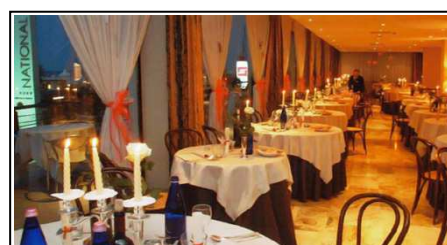
Il ristorante panoramico