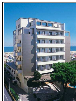
Il National Hotel di Rimini