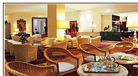
Una parte delle zone comuni dell'hotel