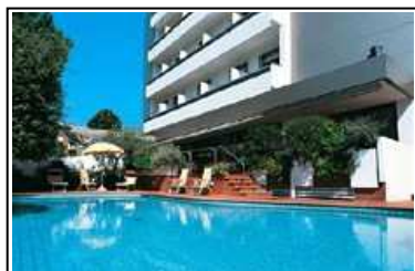
La piscina riscaldata