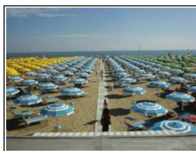
Il Beach 33 di fronte all'hotel