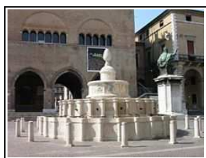
Fontana della Pigna